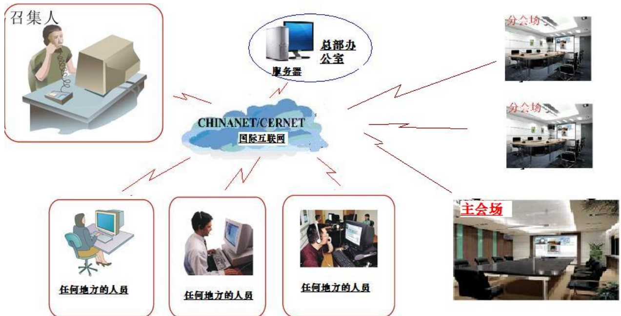
视频会议工作模式示意图