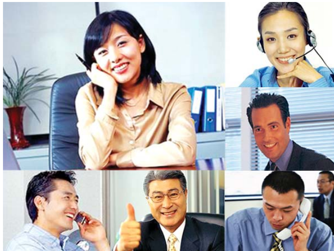
工作人员计算机上的画面