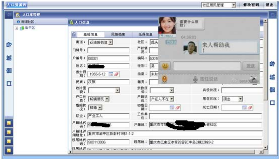
社区服务人员后台的操作界面 1